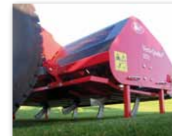
Ideální stroj pro regeneraci golfových drah a fotbalových hřišť