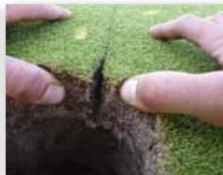
Hloubka prořezu až 15 cm