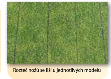
Rozteč nožů se liší u jednotlivých modelů