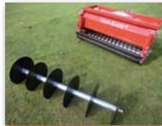
2 typy hřídel v kombinaci pro různé typy prořezu

Verti-Knife je nový multifunkční prořezávač golfových greenů, odpališť a fervejí a jiných sportovních trávníků pracující na principu kombinace disků o různém průměru a různé rozteči, které pronikají do půdy až do hloubky 15 cm. Po narušení vrchních vrstev substrátu dochází ke zlepšení vsakování vody, výměny vzduchu a efektivnějšímu příjmu živin, což má za následek nárůst kořenové biomasy, a tím i zdravý a kvalitní travní drn.