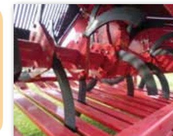
Speciální tvrzené šavlovité nože