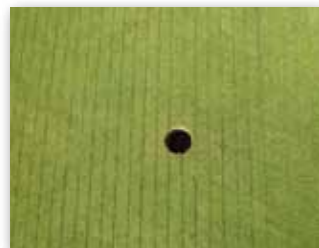
Rozteč nožů od 5 až po 30 cm dle použité hřídele