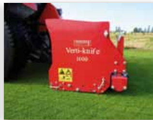
Efektivní a rychlý prořez