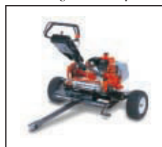
Volitelný podvozek Mower Caddy