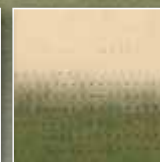
Pro lehký i intenzivní top-dressing