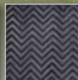
Patentovaný chevronový pás